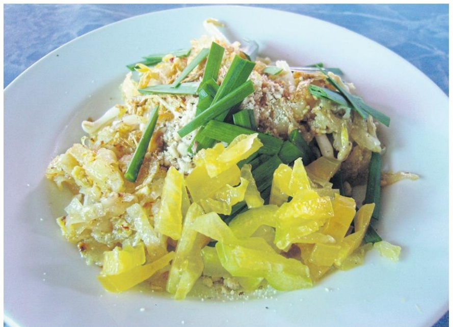
Sliced star fruit scattered on pad Thai .